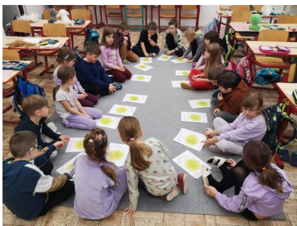
7. 2. 2025 – projektový den: Wellbeing u nás ve škole