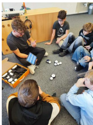
Projektový den: Roboti do škol

Žáci 8. ročníku se zapojili do soutěže společnosti Prusa Research Vlňy a zvuk – „Vizualizuj fyzikální jevy“. Za projekt Vlnění, kmitání a šíření zvuku - soubor pomůcek pro demonstraci, kde s pomocí 3D tisku vytvořili pomůcky do fyziky, jsme vyhráli novou 3D tiskárnu