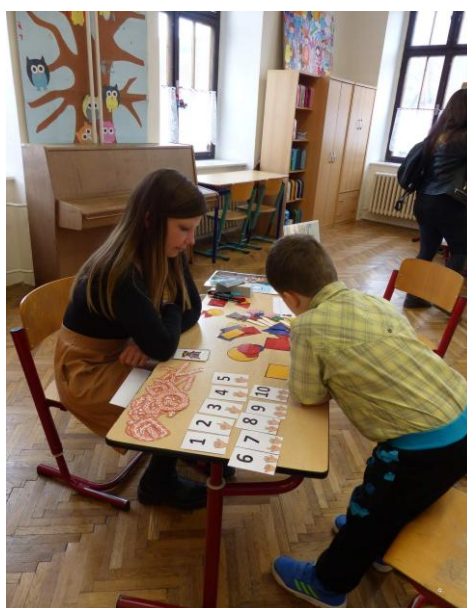
7. 4. 2025 – Zápis do 1. třídy